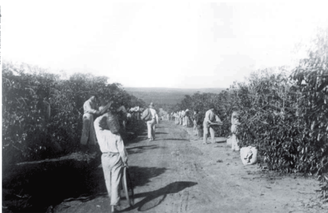
Imigrantes na colheita de café em fazenda no interior do Estado de São Paulo, 1920.