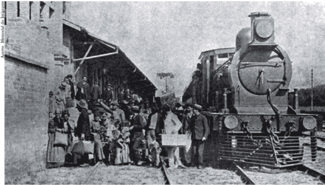
Desembarque de imigrantes na Estação da Hospedaria de Imigrantes em São Paulo, 1907.

ESTUDOS AVANÇADOS - A Abolição acompanhada do subsídio estatal dado à vinda dos imigrantes não teria sido uma espécie de indenização que o governo imperial, e depois o republicano, concedeu aos cafeicultores paulistas?