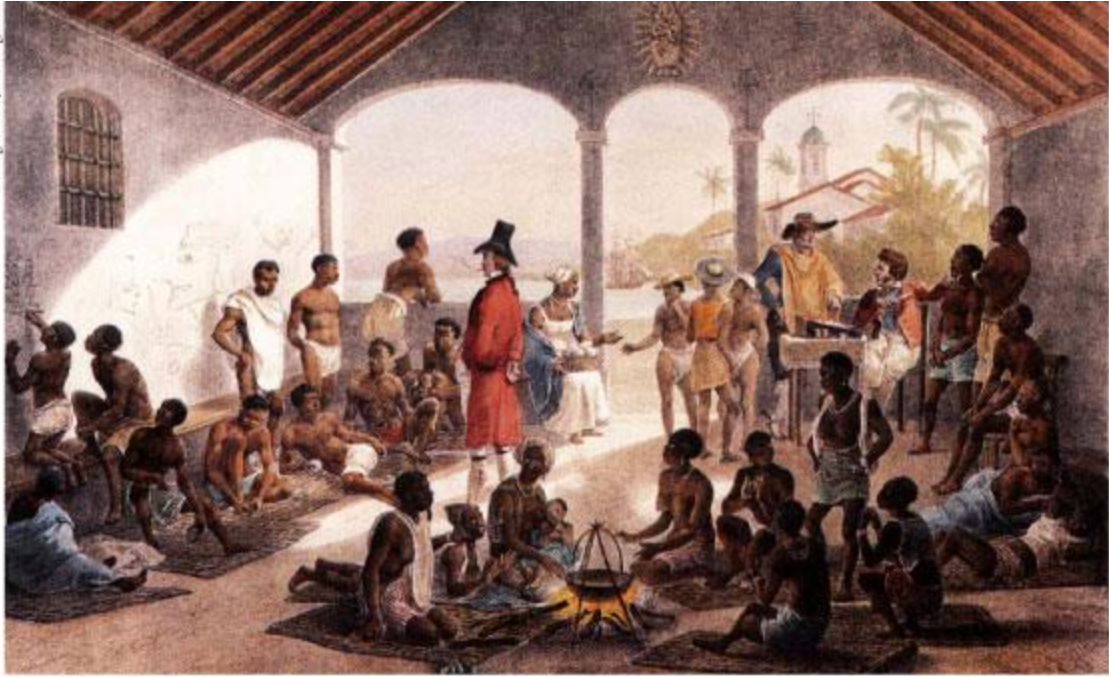
Mercado de escravos