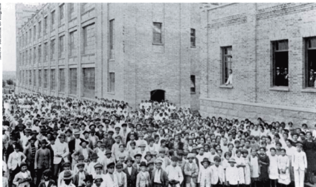
Homens, mulheres e crianças operárias da tecelagem Brasital, em Salto (SP), 1920.