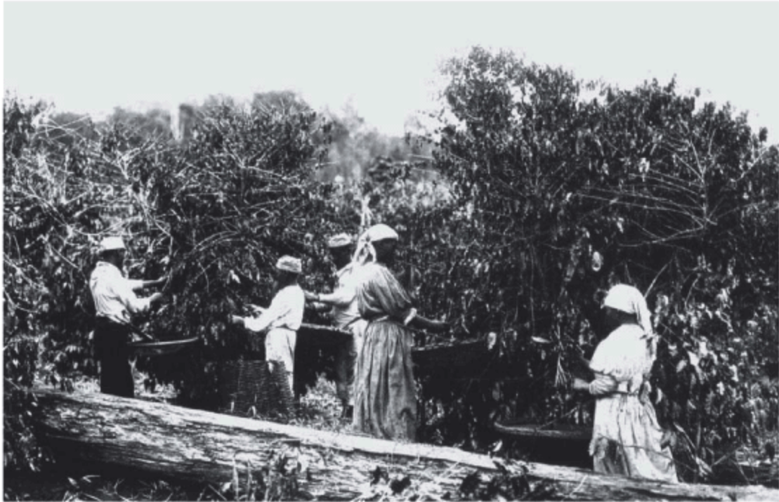
Negros na lavoura de café no século XIX

Os cafeicultores do Oeste Paulista eram modernos na implantação de equipamentos; utilizavam, por exemplo, ferrovias (inclusive particulares, intra e entre fazendas), empregavam o terreiro ladrilhado para a secagem do café, secadores acionavam-se mecanicamente etc. Mas, no que se refere ao trabalho, preferiam o escravo. Simplesmente porque a compra de um escravo era rotineira e garantida, ao passo que os trabalhadores livres ainda eram escassos e esquivos.